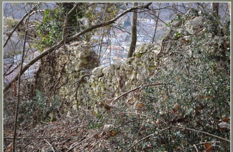
Panorama su Travesio dai ruderi del Ciastelàt

Sentiero facile senza particolari difficoltà con l'uso di scarpe da trekking e abbigliamento consono al tempo.